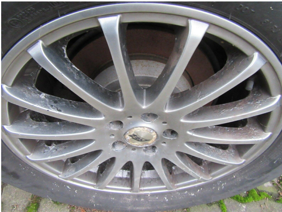
Bild 10 : Felge hinten links, korrodiert, lackieren mit Lackaufbau