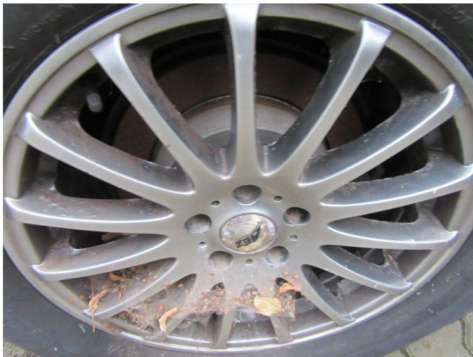
Bild 11 : Felge hinten rechts, korrodiert, lackieren mit Lackaufbau