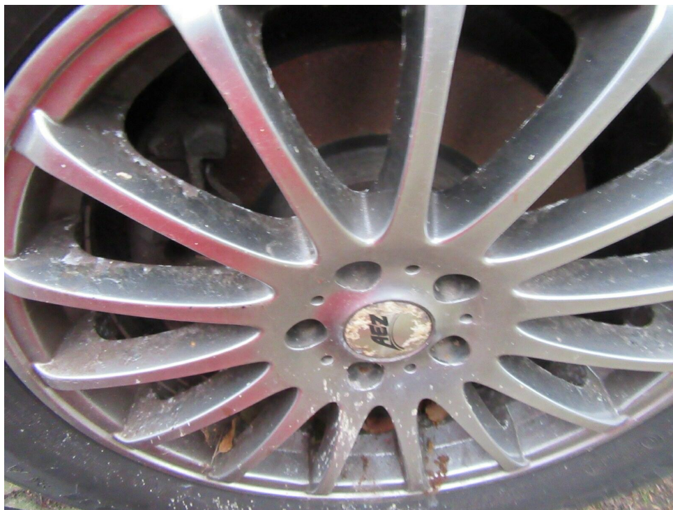
Bild 12 : Felge vorne rechts, korrodiert, lackieren mit Lackaufbau