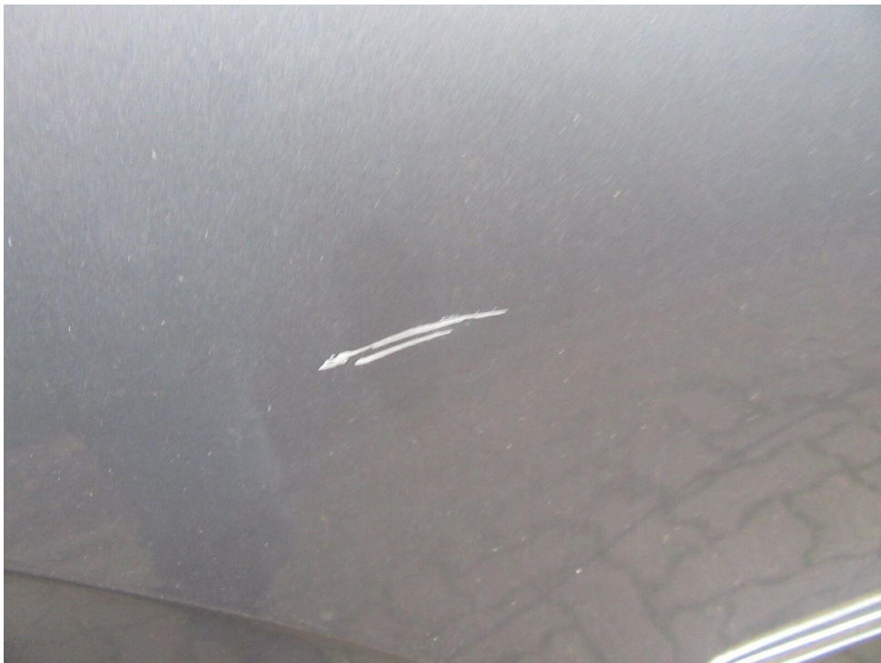
Bild 14 : Tür hinten rechts Lackierung, zerkratzt, lackieren mit Lackaufbau