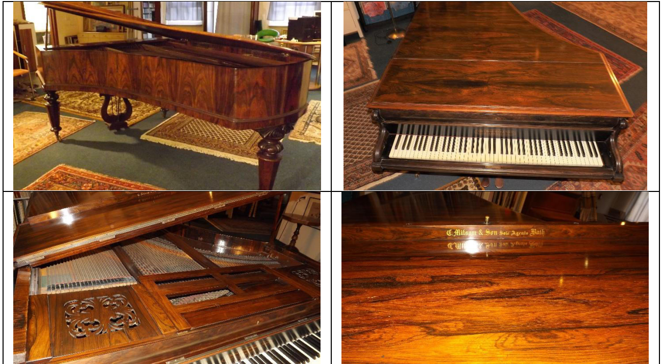
Auswahl der übermittelten Aufnahmen der Holzoberflächen des Flügels